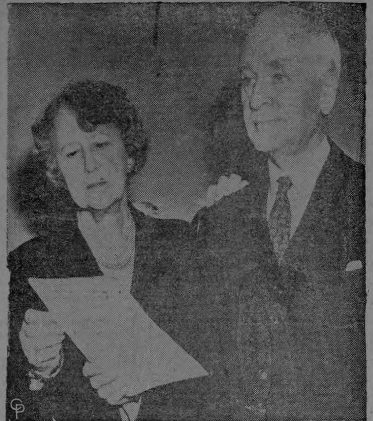
El ex-Secretario de Estado de Norteamérica, Cordell Hull, aparece aquí en Washington, en compañía de su esposa, al recibir la noticia de que es el ganador del premio Nobel de la paz.

Oportunamente, ofrecemos otros interesantes detalles sobre el desarrollo de este Primer Congreso Industrial de Costa Rica.