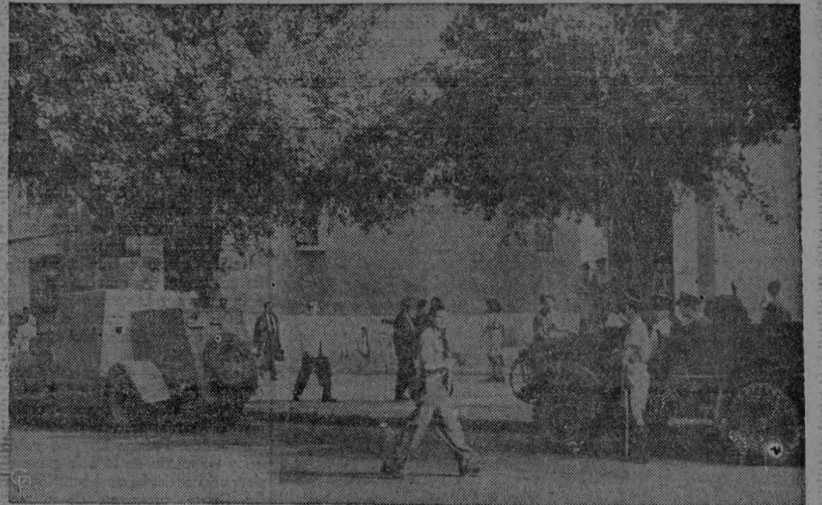
Policías y soldados, en automóviles blindados, custodian un banco Barclays, en Tel-Aviv, Palestina, donde se guardan millares de libras esterlinas para el pago de los salarios de los empleados del Gobierno y de las fuerzas del Gobierno Británico en la Palestina.